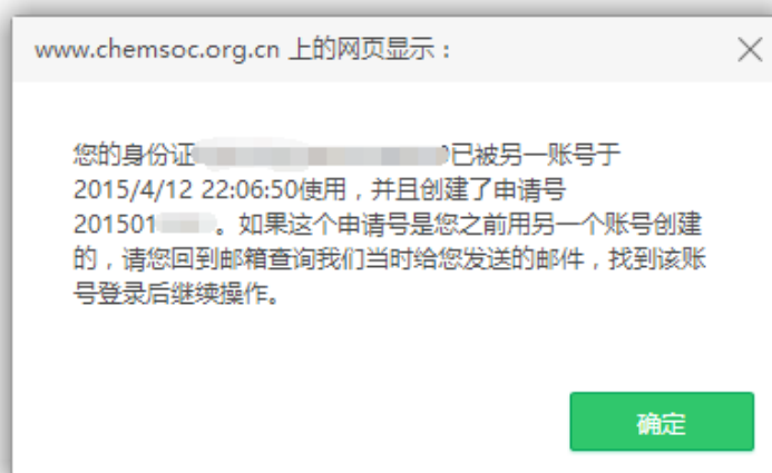
图 7 重复申报奖励提示页面

提示： 非中国化学会会员需先办理入会手续，成为个人会员后，再申报学会奖励。忘记会员证号的申请人可登录个人会员中心，查看会员证号。如果忘记登录密码，可通过注册时的 Email 和姓名重置密码。