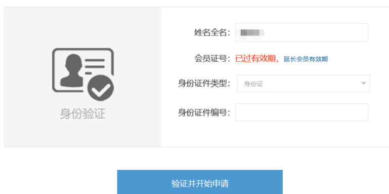
图 4 个人会员过期提示

如果点击“验证并开始申请”后，页面显示“已过有效期”（图 4），表示申请人的会员身份已经过期。可点击蓝色字体“延长会员有效期”，先缴纳会员费，成为有效个人会员后，再行申报（图 5）。